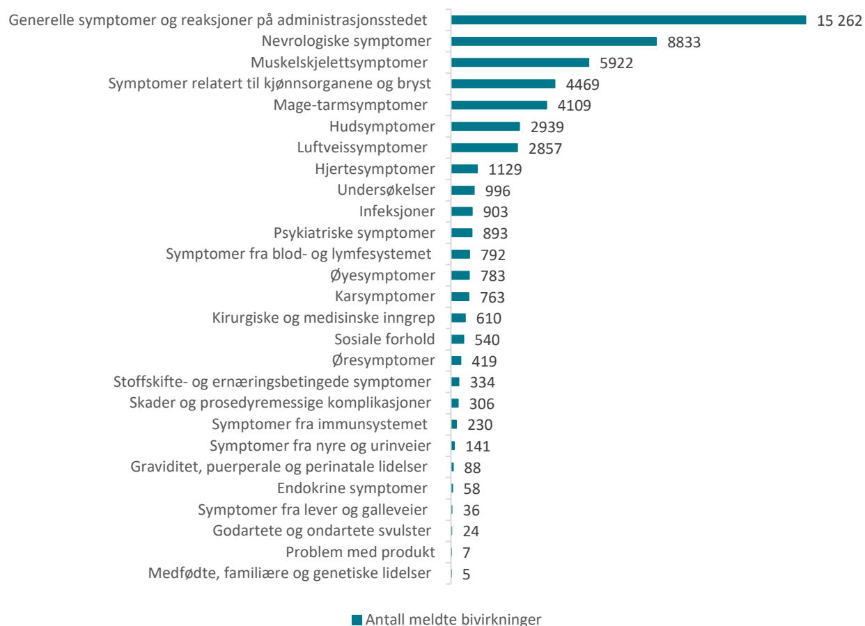
Figur 1: Meldte mistenkte bivirkninger fordelt etter kategori Comirnaty og Spikevax

De hyppigst meldte symptomene etter mRNA-vaksinene er hovedsakelig kjente bivirkninger i kategorien "Generelle symptomer og reaksjoner på administrasjonsstedet": reaksjoner på injeksjonsstedet eller i vaksinasjonsarmen, nedsatt allmenntilstand, feber, generell sykdomsfølelse, hodepine, svimmelhet, søvnighet, diaré, kvalme og oppkast. Symptomene er oppstått i løpet av 1-2 dager etter vaksinasjon, og er som regel gått over i løpet av noen få dager.