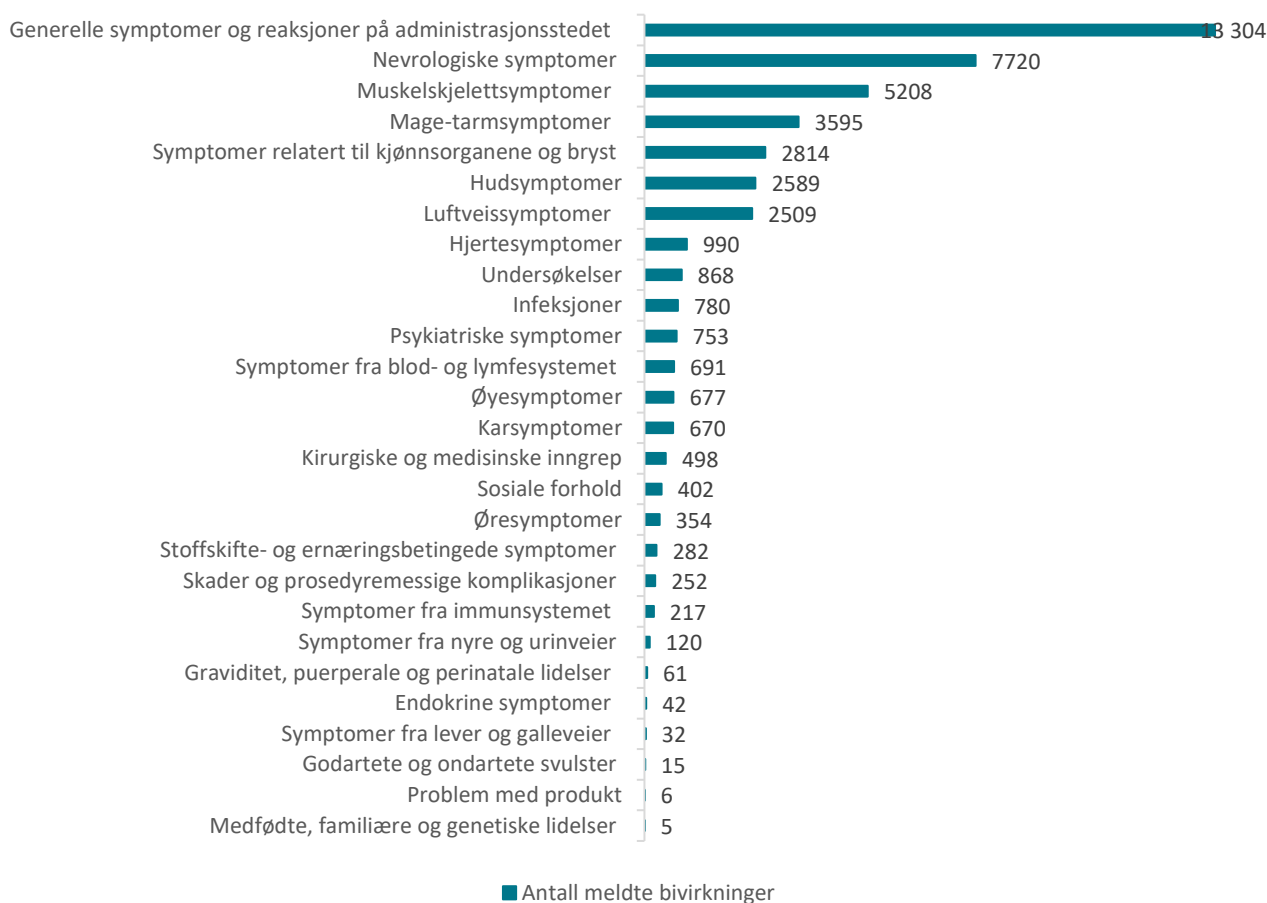
Figur 1: Meldte mistenkte bivirkninger fordelt etter kategori Comirnaty og Spikevax

De hyppigst meldte symptomene etter mRNA-vaksinene er hovedsakelig kjente bivirkninger i kategorien "Generelle symptomer og reaksjoner på administrasjonsstedet": reaksjoner på injeksjonsstedet eller i vaksinasjonsarmen, nedsatt allmenntilstand, feber, generell sykdomsfølelse, hodepine, svimmelhet, søvnighet, diaré, kvalme og oppkast. Symptomene er oppstått i løpet av 1-2 dager etter vaksinasjon, og er som regel gått over i løpet av noen få dager.