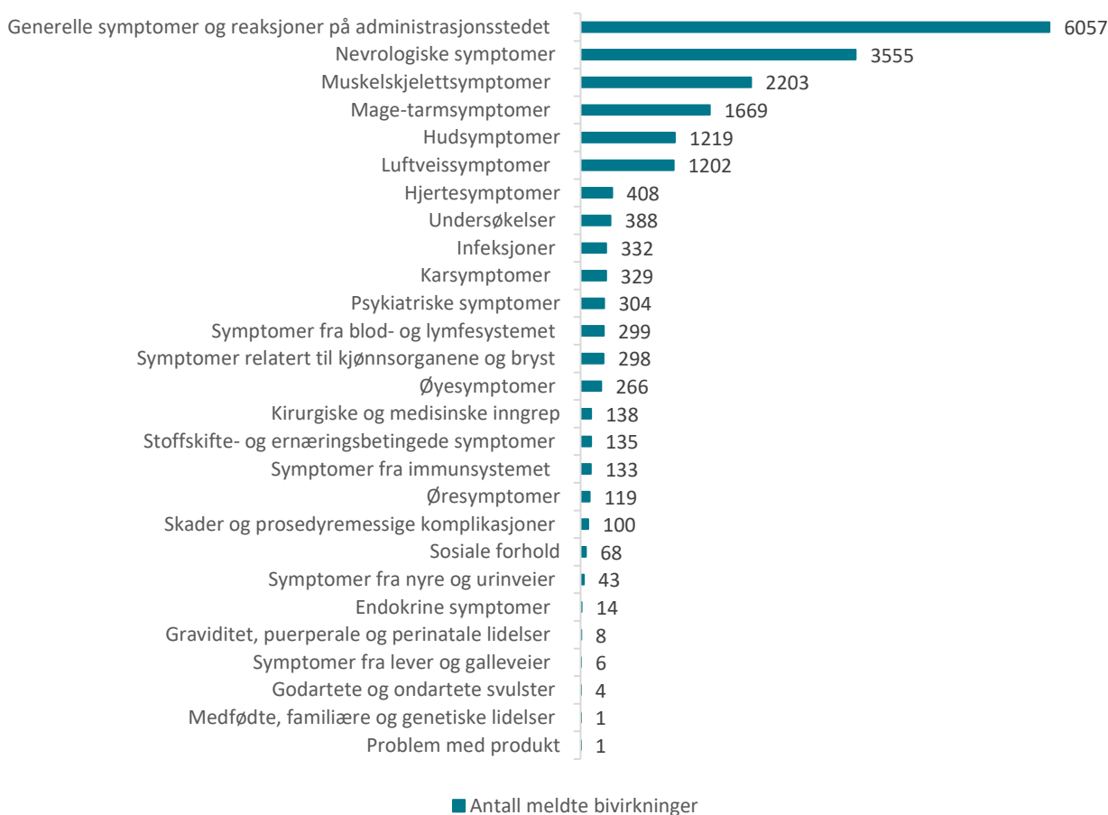
Figur 1: Meldte mistenkte bivirkninger fordelt etter kategori Comirnaty og Spikevax

De hyppigst meldte symptomene etter mRNA-vaksinene er hovedsakelig kjente bivirkninger i kategorien "Generelle symptomer og reaksjoner på administrasjonsstedet": reaksjoner på injeksjonsstedet eller i vaksinasjonsarmen, nedsatt allmenntilstand, feber, generell sykdomsfølelse, hodepine, svimmelhet, søvnighet, diaré, kvalme og oppkast. Symptomene er oppstått i løpet av 1-2 dager etter vaksinasjon, og er som regel gått over i løpet av noen få dager.